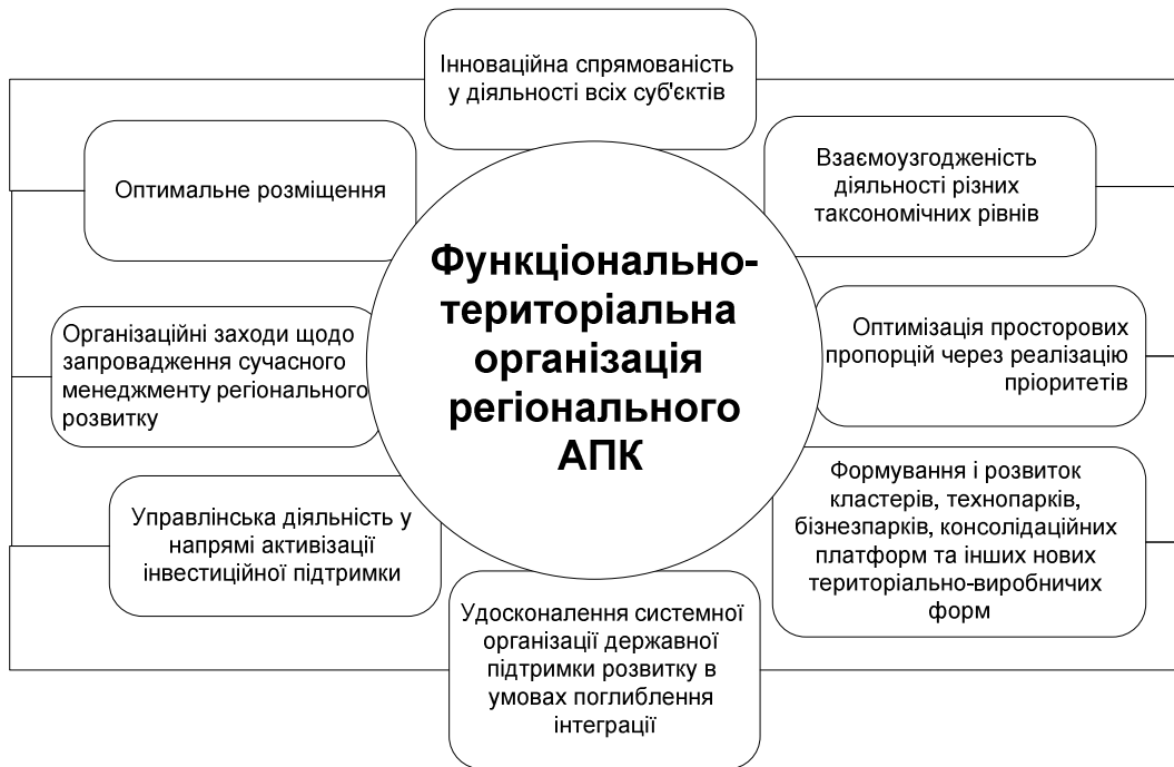
Рис. 1. Органіграма основних компонентів системної організації функціонально-територіального регіонального АПК

Особливу увагу при системній організації регіонального АПК необхідно приділяти її специфічним принципам, властивим тій чи іншій формі, виду чи галузі агропромислового виробництва. Загальновідомо, що одним із необхідних факторів розвитку суб'єктів господарювання АПК є державна аграрна політика. Таким чином, у складі принципів функціонально-територіальної організації агропромислового виробництва регіону повинні бути представлені і принципи підтримки його з боку регіональних органів влади (рис. 2).