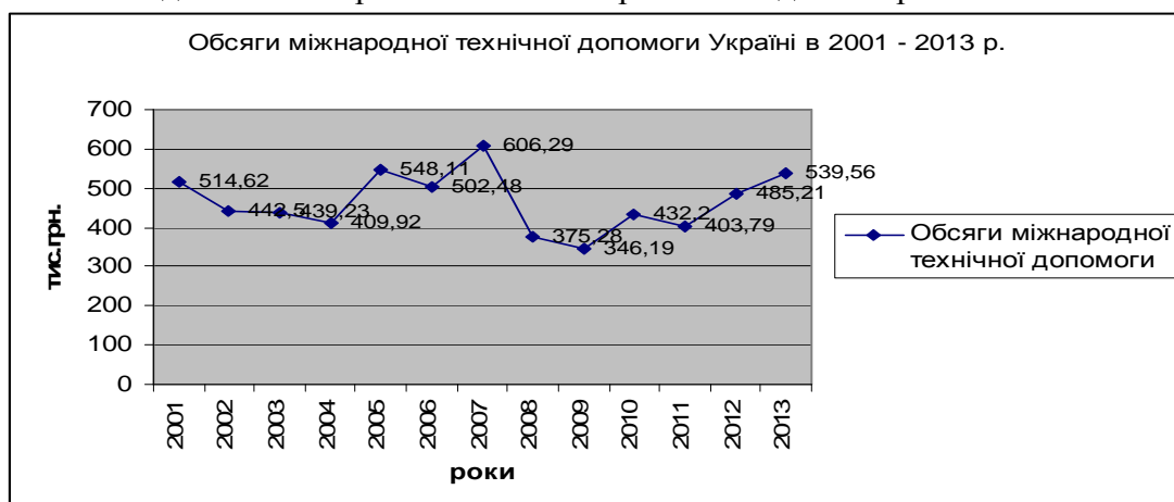
Рис. 2. Динаміка обсягів міжнародної технічної допомоги Україні в 2001-2013 рр. (складено за даними Міністерства економічного розвитку і торгівлі України)

Водночас відбувається і практична реалізація договорів про міжнародну технічну підтримку, механізм реалізації яких встановлений чинною нормативно-правовою базою. Так, у Постанові Кабінету Міністрів України від 15 лютого 2002 р. № 153 «Про створення єдиної системи залучення, використання та моніторингу міжнародної технічної допомоги» зазначається, що міжнародна технічна допомога – це ресурси та послуги, що відповідно до міжнародних договорів України надаються донорами на безоплатній та безповоротній основі з метою підтримки України [8]. Динаміка обсягів міжнародної технічної допомоги Україні в 2001-2013 роках наведена на рис. 2.