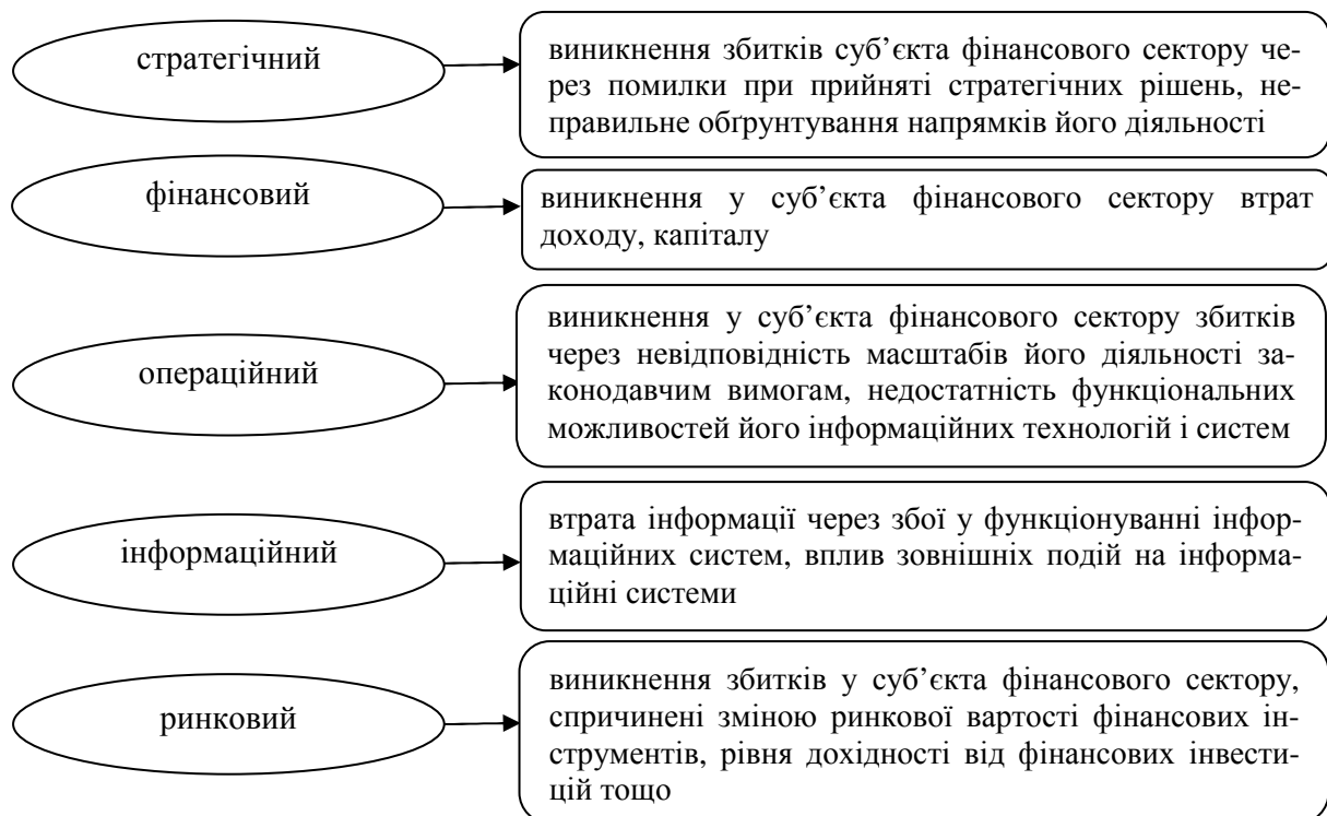
Рис. 2. Ризики діяльності суб'єктів фінансового сектору та форми їх прояву

Характерні ризики, що виникають у процесі діяльності суб'єктів фінансового сектору, та форми їх прояву наведено на рисунку 2.