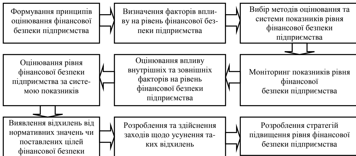
Рис. 3. Схема формування механізму забезпечення фінансової безпеки підприємства