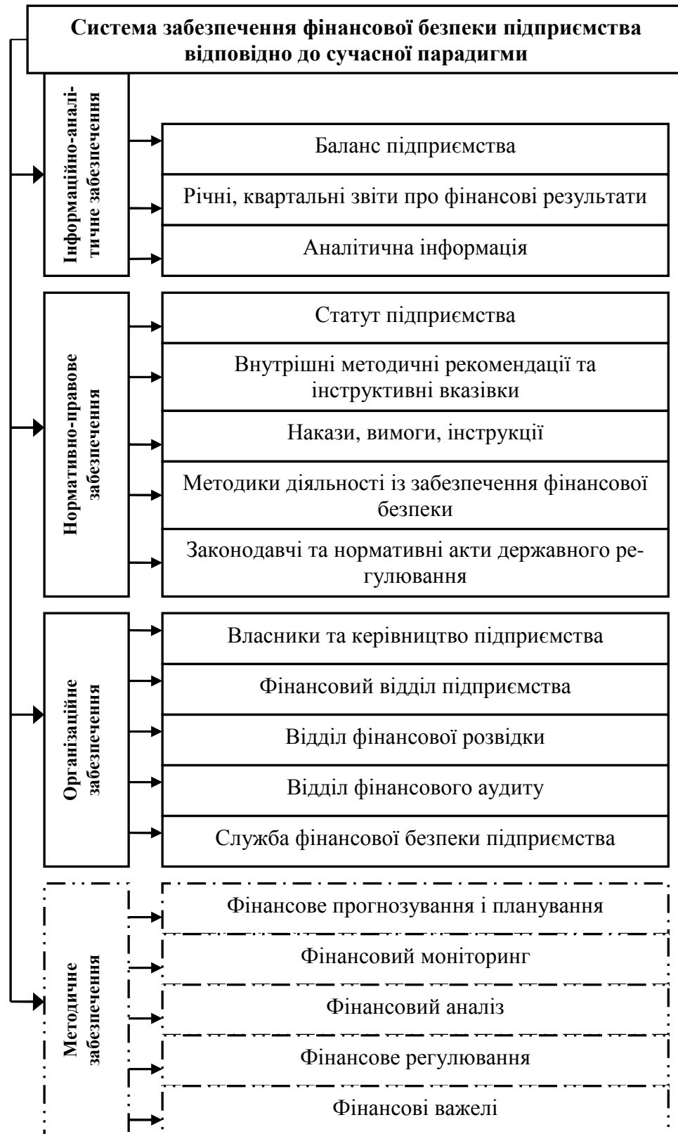
Рис. 1. Система забезпечення фінансової безпеки підприємства відповідно до сучасної парадигми