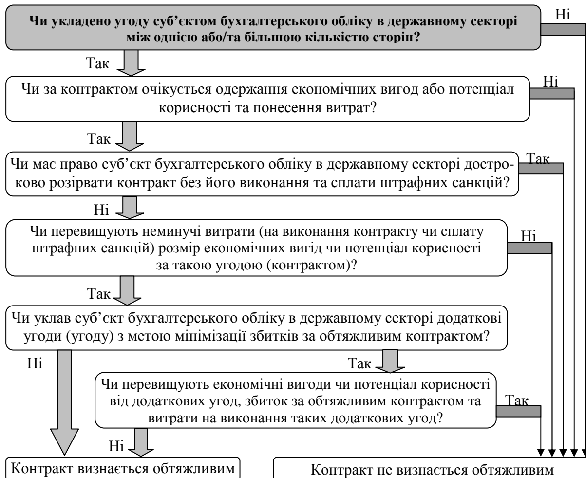
Рис.1. Дерево прийняття рішення щодо визнання контракту обтяжливим у суб'єктів бухгалтерського обліку в державному секторі

На підставі уточнення дефініції поняття «обтяжливий контракт» нами розроблено дерево прийняття рішення щодо визнання контракту обтяжливим, яке наведено на рисунку 1.