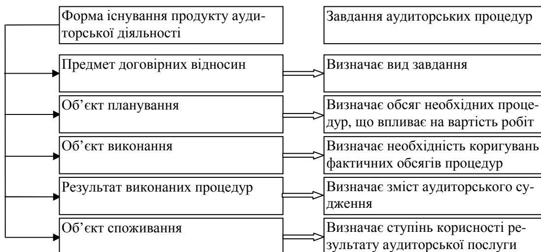
Рис. 1. Зв'язок між суттєвістю та завданнями аудиторських процедур (власна розробка)

Ми повністю поділяємо думку Шапошникова Д.С., про те що сучасні практичні проблеми аудиторської діяльності пов'язані з тим, що «застосування рівня суттєвості для оцінки впливу викривлень на достовірність звітності являє недостатньо досліджений сектор аудиторської діяльності. Розмежування двох станів звітності, які називаються достовірними та недостовірними, знаходиться часом в площині відчуттів, ніж будь-яких свідомих пояснень» [6].