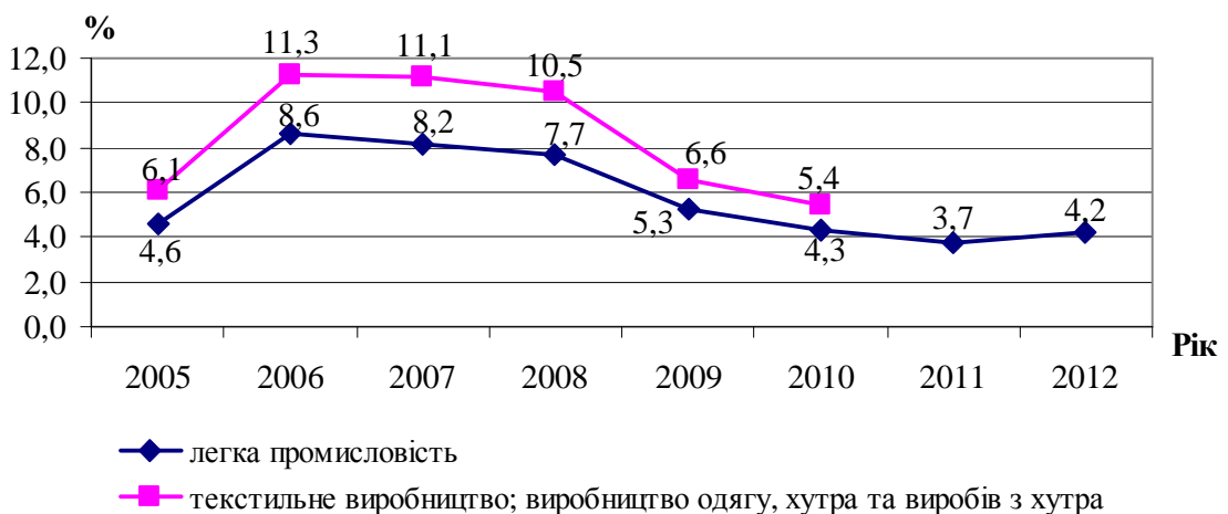
Рис. 2. Питома вага реалізованої продукції легкої промисловості Чернігівської області в Україні

Враховуючи те, що частка реалізованої промислової продукції Чернігівської області у 2012 році становила 1,4 % від загальноукраїнського обсягу, питома вага реалізованої продукції підприємств легкої промисловості Чернігівської області в Україні займає більшу частку – 4,2 %, хоча і має тенденцію до зниження (у 2006 році вона становила 8,6 % серед 24 областей, а частка реалізованої продукції підприємств, що займалися виробництвом текстилю, одягу та хутра, – 11,3 %). Дані свідчать про важливість галузі області у промисловості України загалом (рис. 2).