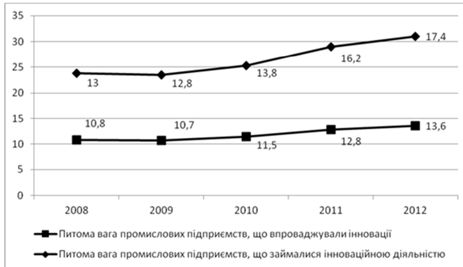
Рис. 3. Динаміка питомої ваги промислових підприємств, що займаються інноваційною діяльністю та впроваджували інновації