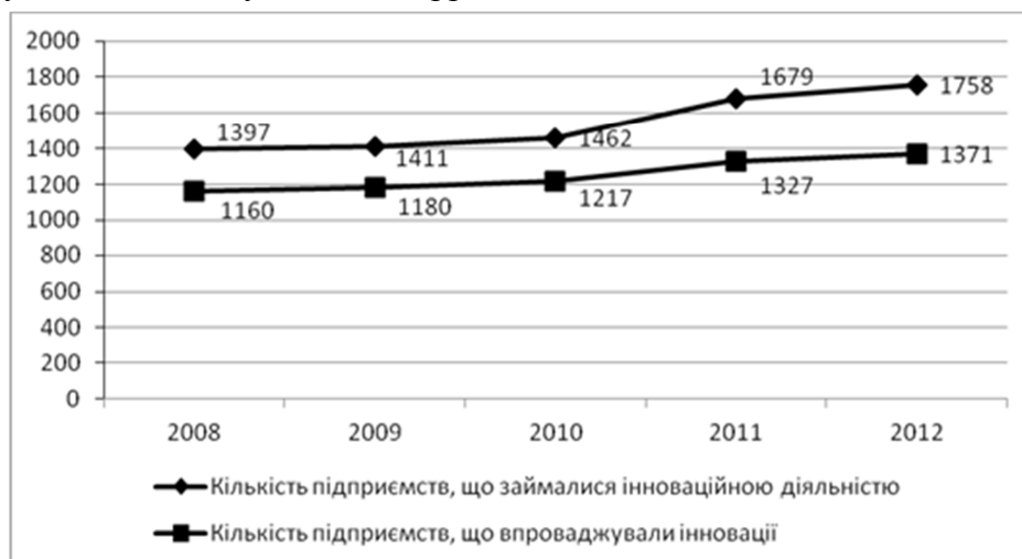
Рис. 2. Динаміка загальної кількості промислових підприємств України, що займалися інноваційною діяльністю та впроваджували інновації

При цьому весь комплекс проблемних питань щодо інноваційного розвитку вітчизняної економіки, окреслений науковцями у роботах [1; 4-6; 8; 17], повністю віддзеркалюється на промислових підприємствах країни. Зокрема, на рис. 2-3 наведено динаміку кількості промислових підприємств, що займалися інноваційною діяльністю, та тих, що впроваджували інновації у 2008-2012 рр.