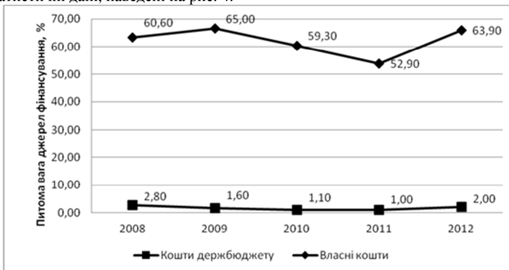
Рис. 4. Динаміка фінансування інноваційної діяльності промислових підприємств за рахунок власних коштів та коштів держбюджету

Однією з таких проблем є непослідовність державної інноваційної політики щодо підтримки інноваційного розвитку вітчизняної промисловості, що наочно демонструють статистичні дані, наведені на рис. 4.