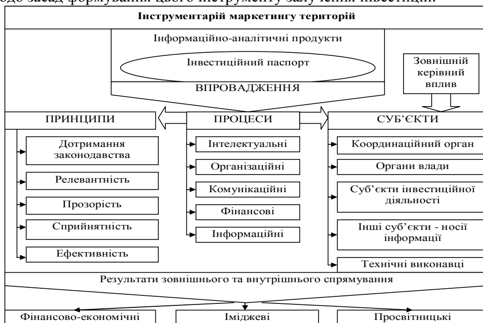
Рис. 1. Схема впровадження інвестиційного паспорта

У сучасній практиці для просування інвестиційних проектів та пропозицій найбільш широко використовуються різного роду інформаційно-аналітичні видання, серед яких першість належить так званим інвестиційним паспортам. На рис. 1 представлено пояснення щодо засад формування цього інструменту залучення інвестицій.