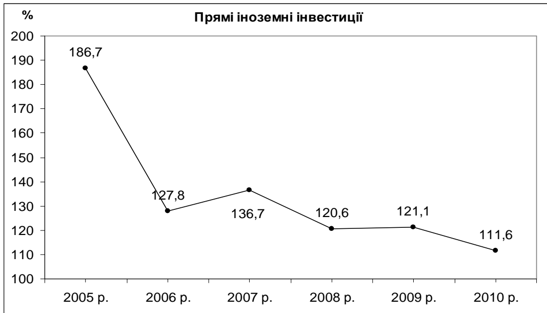
Рис. 1. Індеси прямих іноземних інвестицій до попереднього періоду [10]

Нестабільна соціально-економічна ситуація у країні та її регіонах суттєво гальмує процеси залучення у регіон прямих іноземних інвестицій, про що свідчить зменшення у 2010 р. індексу цього показника у порівнянні з попереднім періодом (рис. 1).