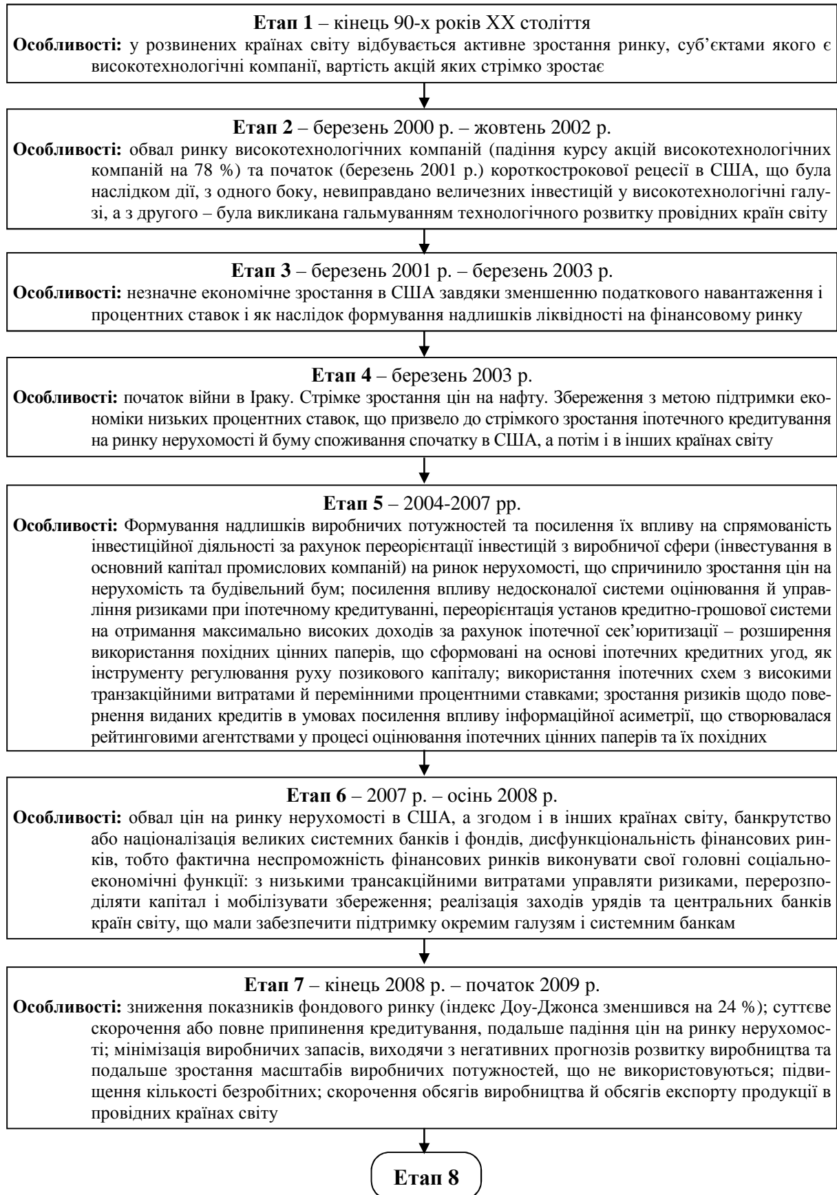
Рис. 3. Етапи розгортання світової фінансово-економічної кризи 2007-2009 рр.