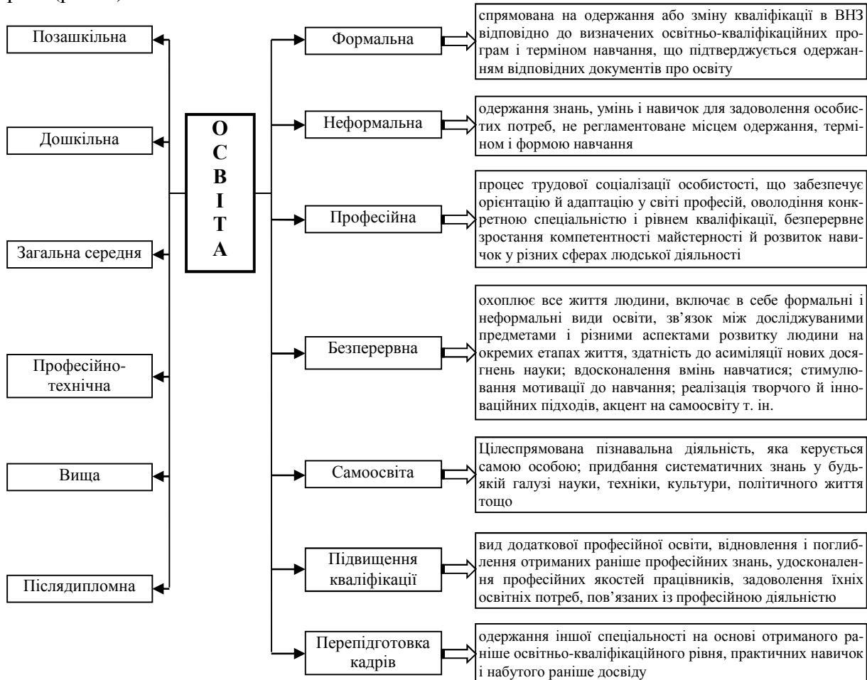
Рис. 2. Багатофункціональна структура освіти

реальних та потенційних працівників професійних знань та умінь з метою набуття навичок, необхідних для виконання певних видів робіт. Такі знання можна здобути як у закладах професійної підготовки, так і безпосередньо у процесі виробництва. Освіта та професійна підготовка становлять багатофункціональну систему зі складною структурою (рис. 2).