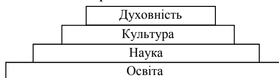
Рис. 1. Структурні компоненти інтелектуального потенціалу

Виклад основного матеріалу. Структурно інтелектуальний потенціал представлений такими компонентами, як освіта, наука, культура та духовність. Авторське розуміння внутрішньої структури інтелектуального потенціалу ґрунтується на таких припущеннях. По-перше, кожен структурний елемент інтелектуального потенціалу містить багато спільних ознак, як, наприклад, пізнання, розум, проникливість, креативність, що робить його визначальним фактором економічного зростання та конкурентним чинником у міжнародній конкурентній боротьбі. По-друге, всі компоненти інтелектуального потенціалу за своїми функціональними характеристиками не лише доповнюють один одного, а поступово долучаються до процесу його формування і подальшого зростання. Схематично процес формування інтелектуального потенціалу із послідовним залученням усіх компонентів представлено на рис. 1.