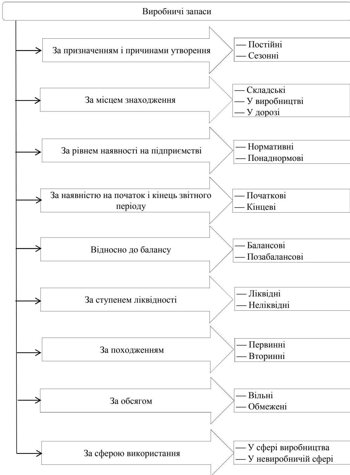
Рис. 2. Класифікація виробничих запасів

За призначенням і причинами утворення науковці поділяють виробничі запаси на постійні і сезонні. Постійні – це частина виробничих і товарних запасів, що забезпечують безперервність виробничого процесу між двома черговими поставками. Сезонні – запаси, що утворюються при сезонному виробництві продукції чи при сезонному транспортуванні.