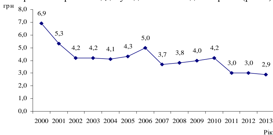
Рис. 2. Динаміка ефективності інноваційних витрат

Структура фінансування науково-технічних і наукових робіт, як і динаміка виконаних робіт, демонструє стратегічну орієнтацію держави на підтримку інноваційного розвитку сільського господарства і біологічних наук. Це ще раз підкреслює спрямованість на формування інноваційного ресурсу галузей 3-4-го технологічного укладу. В той час як пост-індустріальні країни зосереджують власні державні пріоритети інноваційного розвитку на підтримці галузей 6-го технологічного укладу. Тобто на сучасному етапі відбувається закладення інноваційного ресурсу, зорієнтованого на індустріальну наукову парадигму. Динаміка ефективності інноваційних витрат дозволяє зробити висновок про доцільність фінансування обраних напрямів і віддачу від кожної вкладеної гривні (рис. 2) [3].