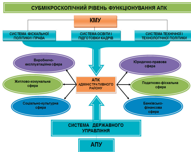
Рис. 2. Субмікроскопічний рівень ПС

ВРУ – Верховна Рада України АПУ – Адміністрація Президента України КМУ – Кабінет Міністрів України ВСУ – Верховний суд України АПК – агропромисловий комплекс України