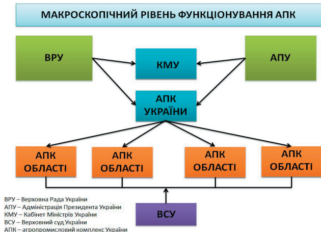
Рис. 1. Макроскопічний рівень ПС

Другим рівнем деталізації проектного середовища для реалізації Програми є рівень областей і регіонів держави. Головними чинниками його впливу стають міністерства і відомства, органи юстиції і податкової адміністрації, структурні складові системи освіти і підготовки кадрів, технічної і технологічної політики держави, виконавчі органи обласних державних адміністрацій і обласних рад народних депутатів.