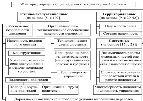
Рис. 4. Классификация факторов, которые определяют надежность транспортной системы (предлагается) (с учетом [5, с.107; 9, с.29-42; 17, с.28])