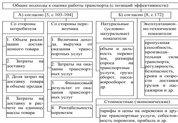
Рис. 2. Примеры подходов к оценке работы транспорта с позиций эффективности