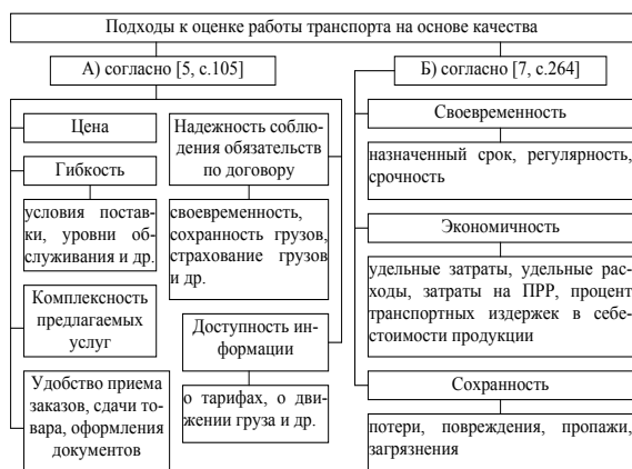
Рис. 3. Примеры подходов к оценке работы транспорта на основе качества

Опираясь на данные предложенной классификации (рис. 4), а также принимая во внимание современные тенденции в развитии теории и практики транспорта, можно выделить следующие направления исследований в рамках транспортной диагностики – рис. 5.