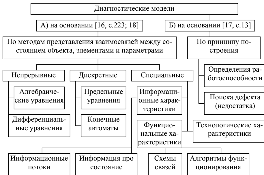
Рис. 2. Классификации диагностических моделей на транспорте (на основе [16, с.223; 17, с.13; 18])

Далее синтезируем классификацию диагностических моделей для транспортной диагностики, используя данные работ [16, с.223; 17, с.13] – рис. 2. В табл. 2 приведена краткая характеристика основных групп диагностических моделей. В качестве альтернативы термину «дефект» предлагается в рамках транспортной диагностики использовать термин «недостаток» или «неисправность».