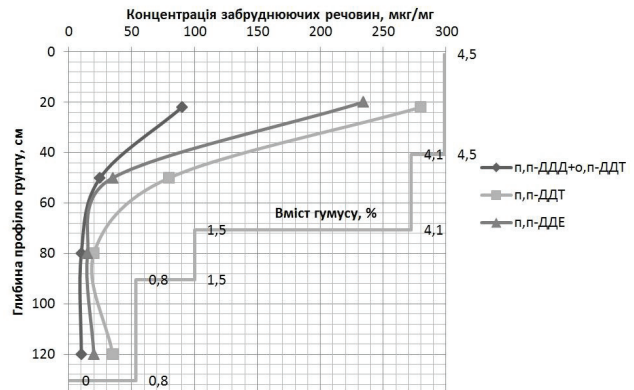
Рис. 2. Залежність вертикального розподілу ДДТ та його метаболітів від вмісту гумусу у профілі лучного ґрунту

дів пестицидів та добрив, місця аварійних розливів). В обох випадках опади виступають ініціатором переміщення, натомість евапорація не матиме суттєвого впливу у випадку забруднених місць з високими концентраціями пестицидів на порівняно невеликих ділянках, тому нею можна знехтувати. У ґрунті хімікати адсорбуються часточками ґрунту, але оскільки процес адсорбції (як і інші процеси масообміну) зворотний, то через деякий час, під впливом комплексу чинників (рис. 1) пестициди знову звільнюються (десорбція). ЧкП), що призводить до розкладання токсикантів на менш токсичні метаболіти (М), а частково переходять на наступний етап ( P(1-k_1-k'_1) ). Ці метаболіти, в свою чергу, частково виводяться у суміжні системи ( a_1'M ), а частково переходить на наступний етап ( M(a_1-a'_1) ), де розкладаються до нетоксичних сполук ( M_1 ). Метаболіти першого порядку (М), які утворюються на різних стадіях, матимуть приблизно однаковий склад, але не обов'язково однакову кількість [7]. Вважатимемо, що метаболіти другого порядку ( M_1 ) виводяться з системи, бо являються нетоксичними, і не чинитимуть негативного впливу на довкілля. За такою схемою відбуватиметься перетворення пестициду доги, доки \sum_{i=1}^n (k_i + k'_i) = 1 . У тому випадку, коли потрапляє стільки пестицидів, скільки може бути детоксиковано ґрунтом, то накопичення препарату і його міграції, як правило, не відбувається. Інакше, слід очікувати міграцію та залишкове накопичення.