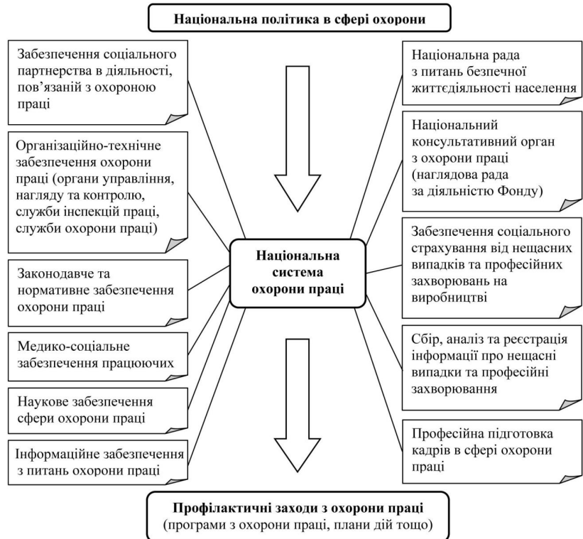
Рис. 1. Структура національної системи охорони праці України

Формування профілактичних заходів на державному рівні повинно здійснюватися з урахуванням оцінки суспільних потреб у вирішенні тієї чи іншої проблеми, а також обліку й аналізу негативних та позитивних факторів зовнішнього середовища (політичних, економічних, соціальних та технологічних), яке взаємодіє з національною системою охорони праці.