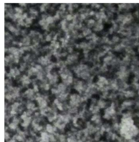
Рис. 2. Компьютерная томограмма фрагмента детали из синтегранта, полученная на томографе Siemens R2000 при напряжении 125 кВ и токе 20 мА; \times 1

Томографические изображения технических гетерогенных материалов типа синтегранта получились сложными, выполненными в оттенках серого (256 градаций яркости от 0 – черный до 255 – белый) и содержащими контрастные переходы и мелкие детали (рис. 2). Все это позволяет отнести их к фотореалистическим, требующим значительной мобилизации всех компьютерных ресурсов при их свертке.