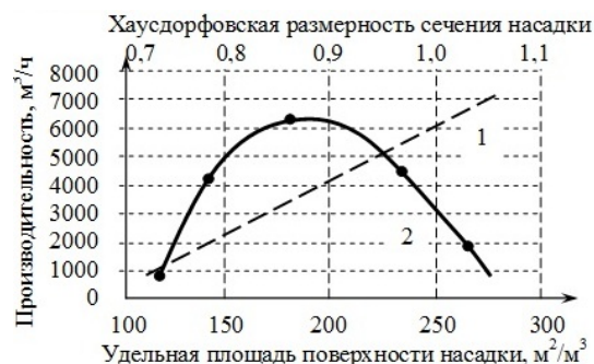
Рис. 4. Теоретическая (1) и реальная (2) зависимости интенсивности абсорбции от площади поверхности насадки

Как следует из (5), при увеличении суммарной площади насадок F интенсивность процесса абсорбции должна линейно и монотонно возрастать (1, рис. 4). Практически это не так, и увеличение суммарной площади поверхности насадки за счет ее измельчения не приводит к линейному возрастанию интенсивности.