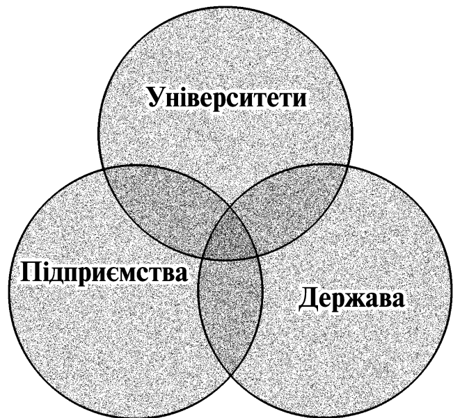
Рис. 1. Трійна спіраль кластеризації економічного розвитку

Еволюція кластерних систем поступово набула вираження трійної спіралі, яка відбиває особливості трансформації світової економіки до інформаційного типу (рис. 1). Цей процесу є наслідком ускладнення організації суспільних систем через зростання інформаційної ємності світу.