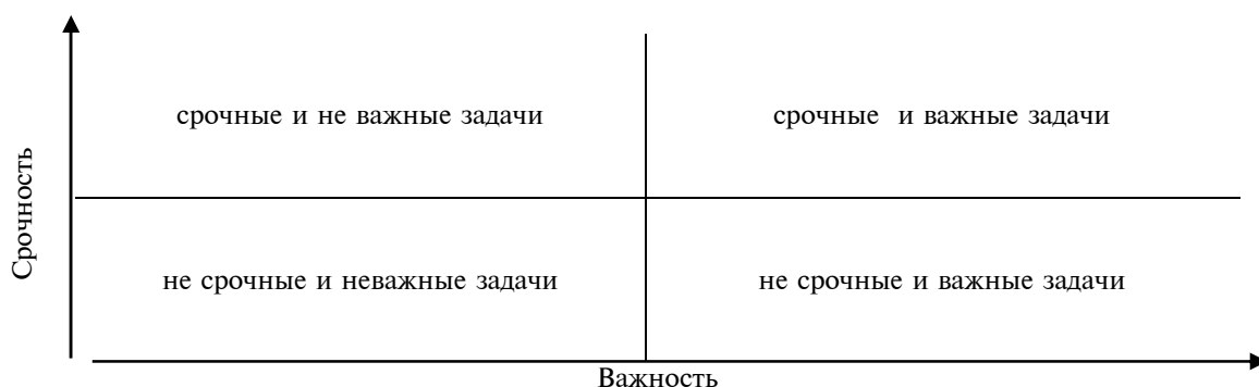
Рис. 2. Матрица «важность-срочность» в выборе приоритетов задач государственного управления [4]

В идеале, задач, расположенных в квадранте «срочные – важные» быть не должно и именно на это должен быть направлен проактивный подход к механизму государственного управления – предотвращение перехода важных задач в квадрант важных и срочных. Постоянная работа в квадранте «срочность-важность» способствует возрастанию «напряженности» работы аппарата государственного управления и, как следствие, – росту доли ошибочных и неверных решений.