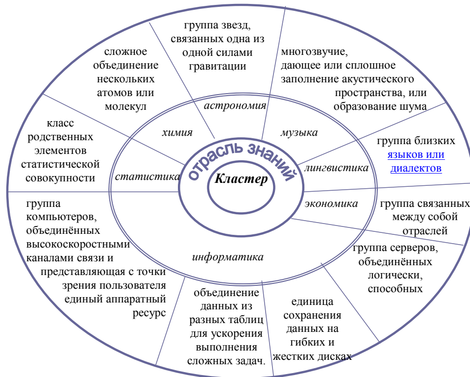
Рисунок 1 - Определение кластера в различных отраслях знаний

субъектов хозяйствования, так и отрасли и региона в целом. Именно это и является принципиальным отличием понятия кластера в экономике от кластера в других отраслях знаний.