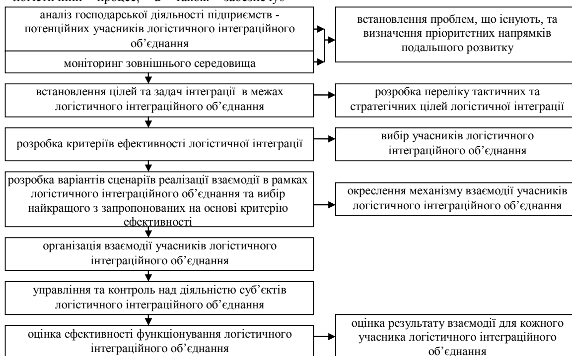
Рисунк 1.2-Послідовність створення та визначення результатів логістичного інтеграційного об'єднання

Кожний потенційний учасник логістичного інтеграційного об'єднання самостійно приймає рішення щодо вступу до нього. Основними етапами його формування є (рис. 1.2):