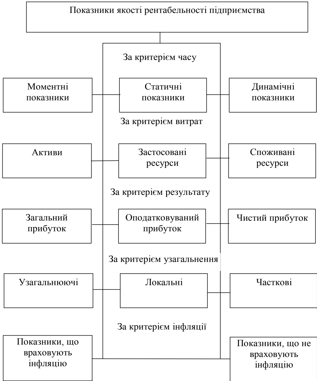
Рисунок 2 - Класифікація показників рентабельності підприємства, що розраховані на базі величини якості прибутку

Теоретико – методичні підходи до підприємства представлено на рисунках 2 і 3. класифікації показників рентабельності