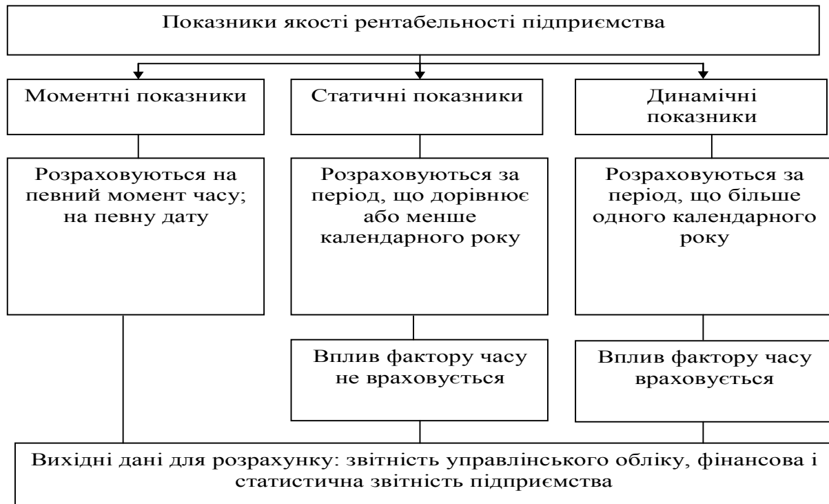
Рисунок 3 - Показники якості рентабельності підприємства, визначені за критерієм часу.

Розглянемо конкретні форми розрахунку показників рентабельності, визначених на базі величини якості прибутку підприємства.