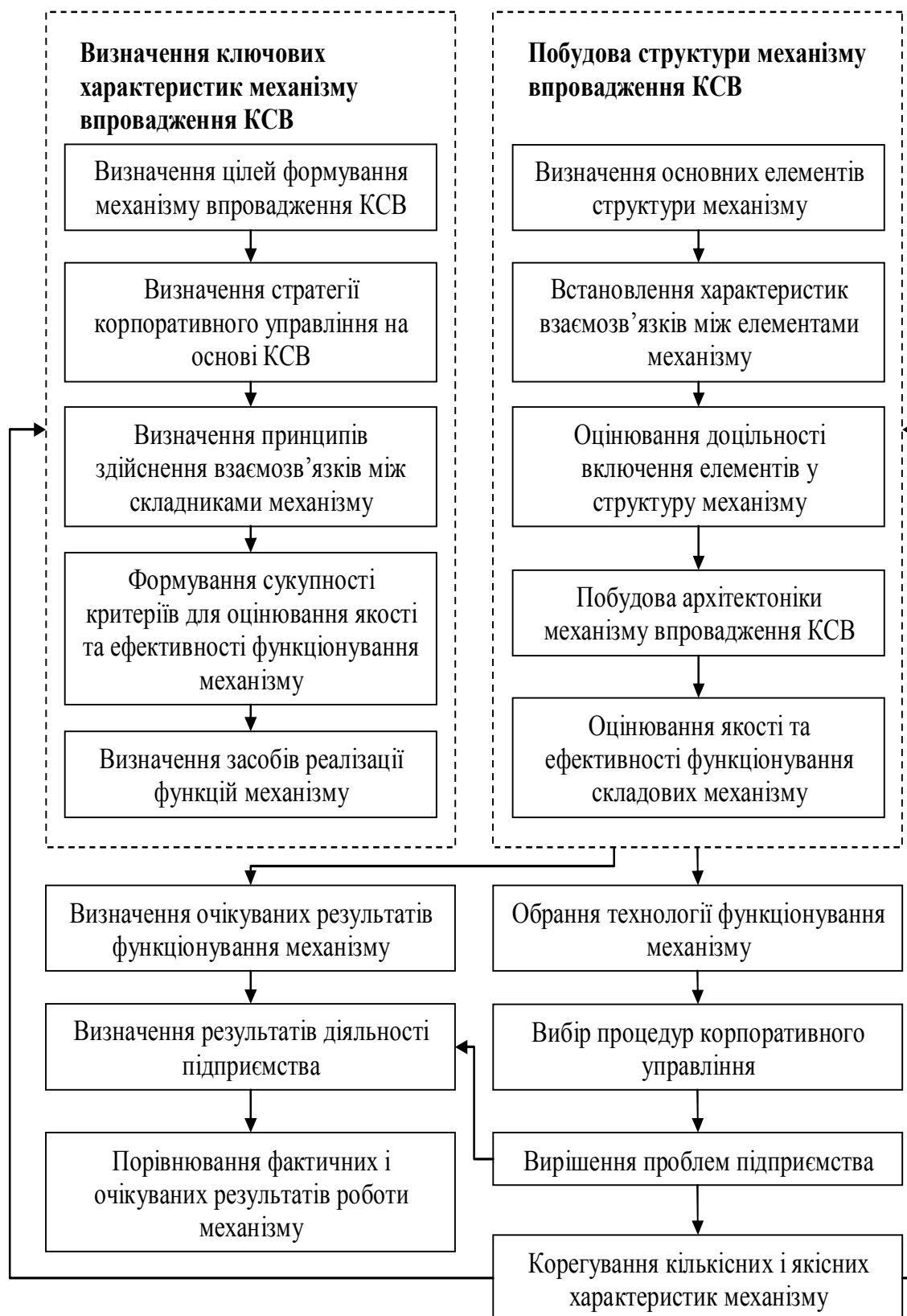
Рисунок 1 - Процесна модель формування механізму впровадження КСВ на підприємстві