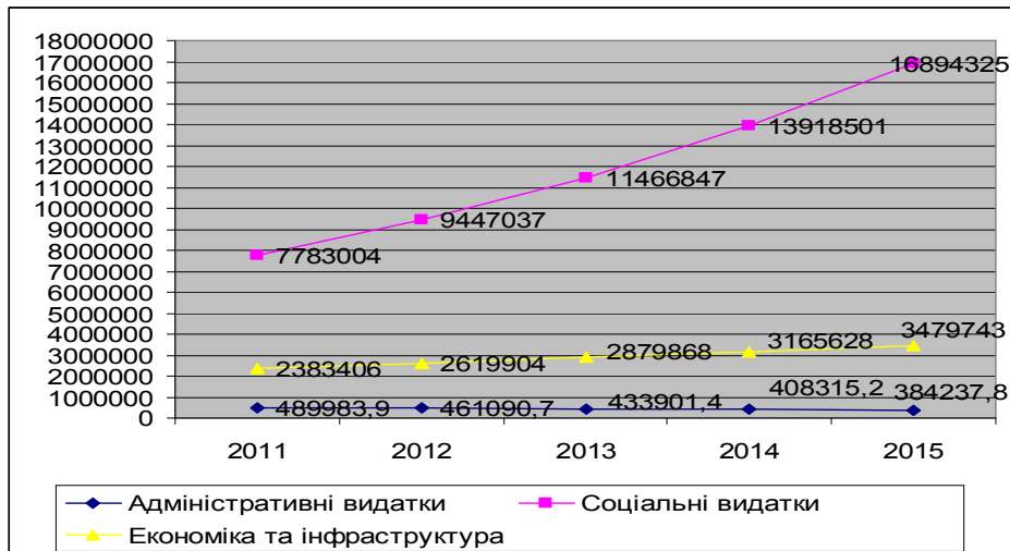
Рисунок 1 - Прогнозні значення видатків зведеного бюджету Харківської області на 2011-2015 рр.