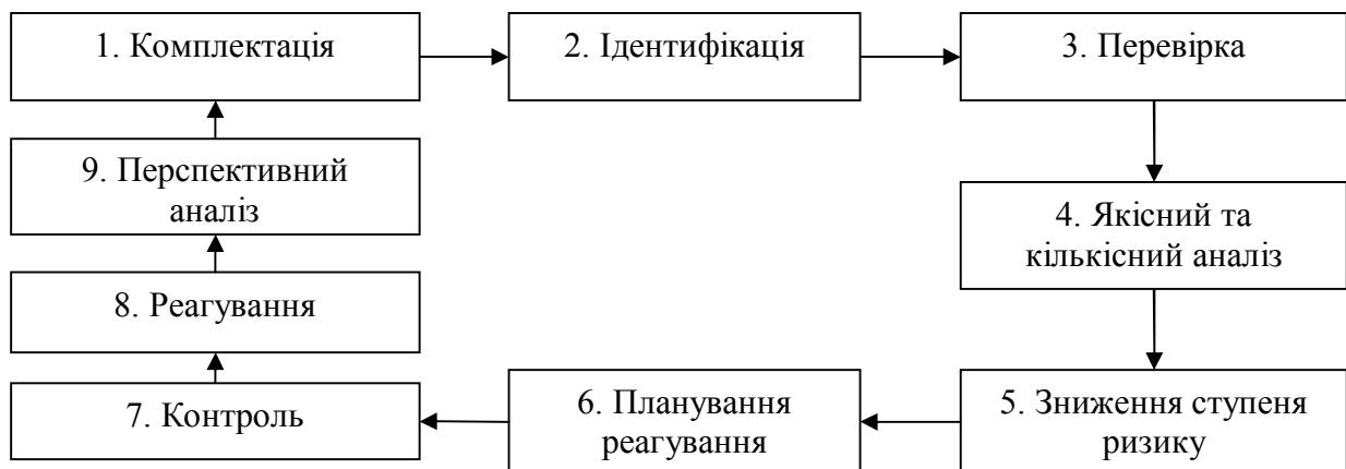
Рисунок 1 – Послідовність етапів процесу управління підприємством в умовах ризику, запропонована Андреевою Т.Є. [9, с.46]

Дослідники Андреева Т.Є. [9] і Стешенко О.Д. [15] розглядають управління ризиками на підприємстві як безперервний (замкнений) процес. Так, наприклад, Андреева Т.Є. акцентує увагу на власних послідовних етапах замкнутого процесу управління підприємством в умовах ризику (рис.1).