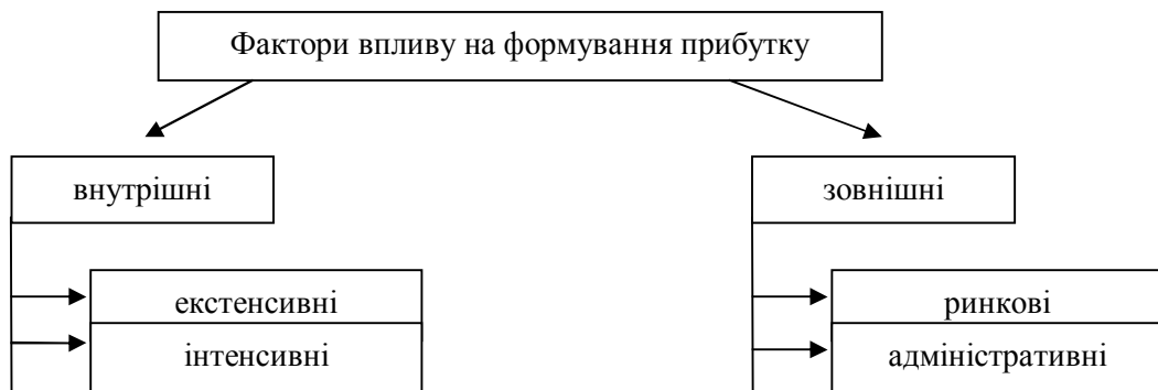
Рисунок 2 – Класифікація факторів, що впливають на формування прибутку банку* *Розроблено автором за матеріалами [4, 6]