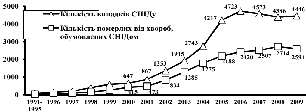
Рис. 1. Кількість нових випадків СНІДу та померлих від хвороб, обумовлених СНІДом, серед громадян України. За:[9, С.6].

Смертність осіб, які вживають наркотики, з року в рік зростає (рис. 1). В Україні з часу виявлення першого випадку ВІЛ-інфекції у 1987 році і до 2009 року включно офіційно зареєстровано 161 119 випадків ВІЛ-інфекції серед громадян України, у тому числі 31 241 випадків захворювання на СНІД, з яких майже 80 відсотків наркомани. Не важко уявити жахливість ситуації з поширенням наркоманії та СНІДу вже сьогодні й особливо в майбутньому. Протягом згаданого періоду зареєстровано 17 791 випадків смерті від захворювань, зумовлених СНІДом [9, С.34].