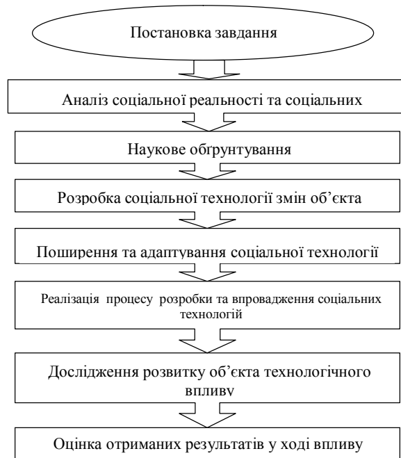
Рис. 1. Алгоритм процесу розробки та реалізації соціальних технологій

Таким чином, за допомогою соціальних технологій та об'єднання різноманітних поглядів на її сутність та напрями практичного використання рекомендуємо сформувати загальний алгоритм процесу її розробки та реалізації (рисунк 1.).