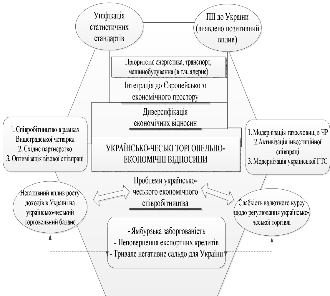
Рис. 1. Графічне зображення системи двосторонніх економічних відносин України і Чеської Республіки [розроблено автором]

Також проблемним питанням двосторонніх українсько-чеських відносин є надання в січні 2011 р. Чеською Республікою притулку колишньому міністру економіки України Б. Данилишину. У цьому контексті, Україні слід враховувати високу солідарність ЄС у випадках недружніх актів по відношенню до держави-члена з боку третьої держави та суттєвий вплив США на політичні рішення чеської сторони. Традиційно підвищена увага до питання дотримання прав людини та демократичних цінностей, а також прагнення сучасного чеського уряду продемонструвати свою принциповість у цих питаннях створює високу ймовірність тривалого продовження справи Б. Данилишина [6].