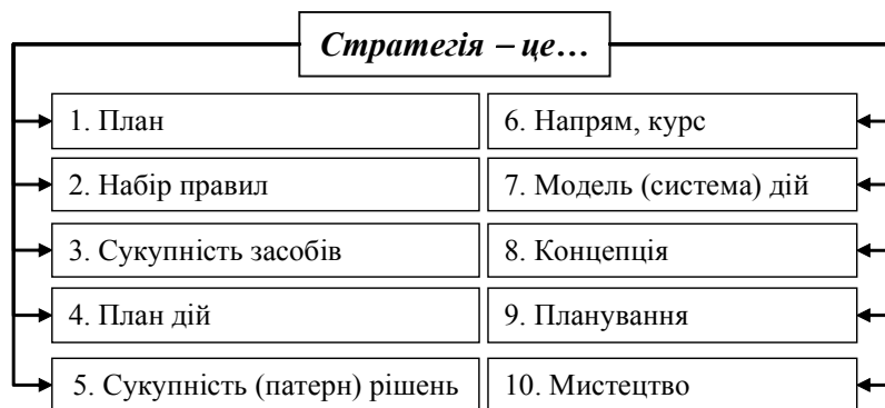
Рису. 1. Сукупність поглядів на сутність поняття «стратегія»

З даною метою був проведений аналіз наукових джерел та розроблено узагальнюючу модель сутності поняття «стратегія» (рис. 1.1).