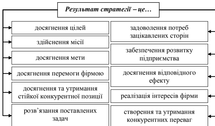
Рис. 3 Схематичне зображення результатів стратегії підприємства

Можна також відмітити, що здійснення місії, реалізація інтересів фірми, досягнення відповідного ефекту та мети є узагальнюючими твердженнями, так як включаючи велику кількість факторів є індивідуальними та орієнтованими на отримання будь-якого бажаного результату.