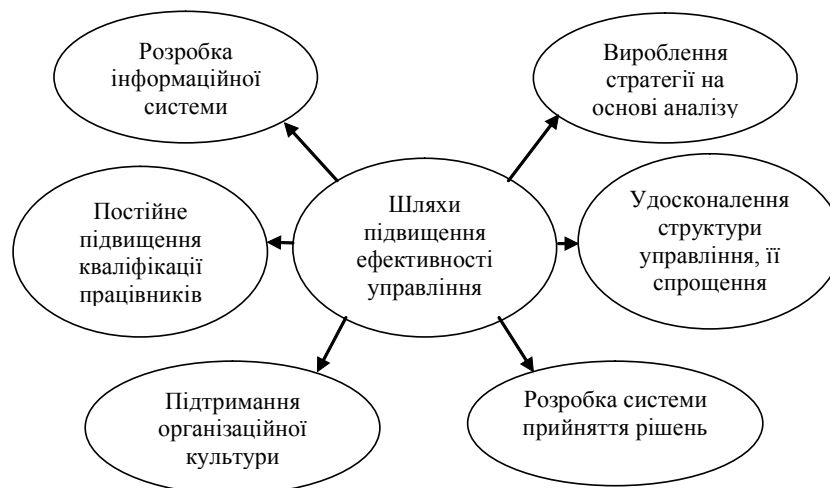
Рис. 2. Шляхи досягнення ефективності управління [Розробка авторів]

На основі аналізу результатів наукових досліджень вчених [8,9,10] визначимо шляхи підвищення ефективності управління керівників та спеціалістів на підприємстві, що наведені на рис.2.