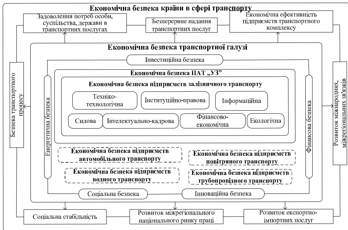
Рис. 4. Економічна безпека залізничного транспорту в системі захисту національних економічних інтересів України

середовище мезорівня. На цьому рівні складовими економічної безпеки залізничного транспорту є техніко-технологічна, інституційно-правова, інформаційна, силова, інтелектуально-кадрова, фінансово-економічна та екологічна безпеки. Місце залізничного транспорту в системі захисту національних економічних інтересів України представлено на рис. 4.