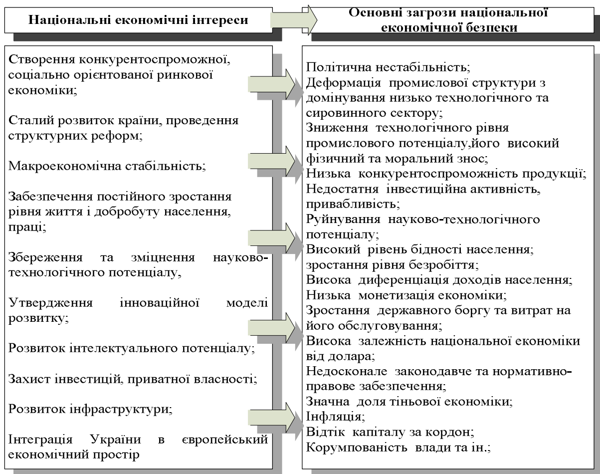
Рис.1. Загрози національним економічним інтересам (сформовано на основі [7,20,24])

В умовах динамічного розвитку, мінливого зовнішнього середовища, загострення конкуренції як на міжнародній арені, так і внутрішніх ринках виникають загрози національним економічним інтересам. Основні макроекономічні загрози національним економічним інтересам представлені на рис.1.