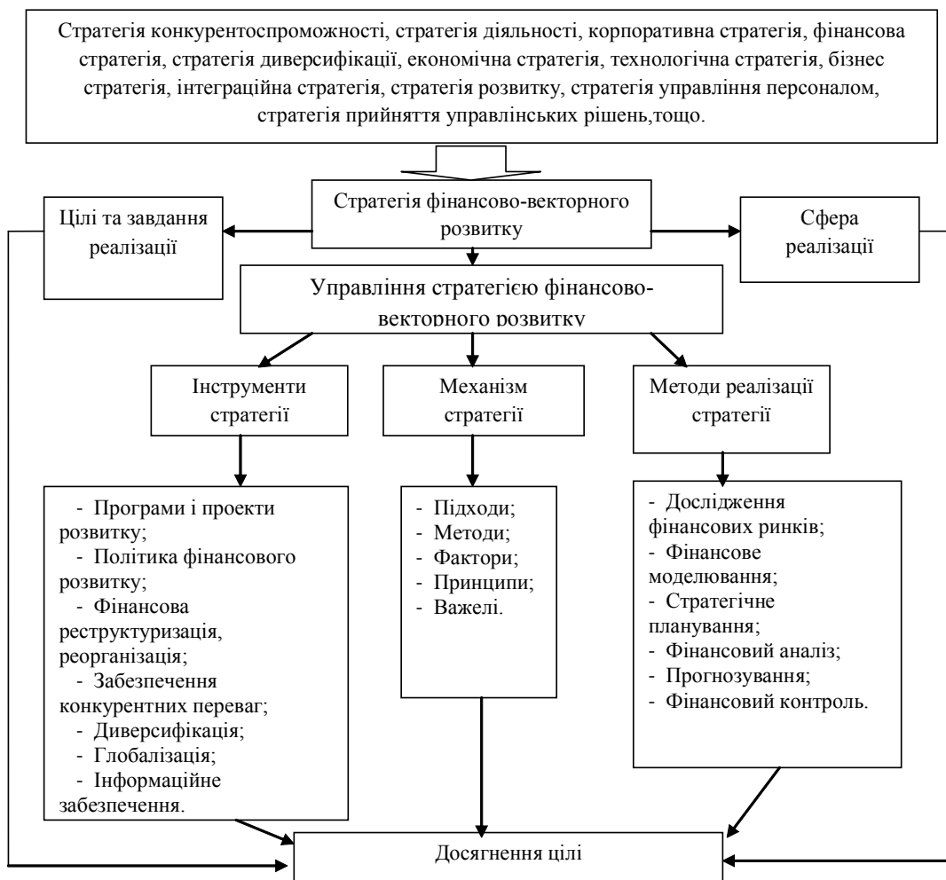
Рис. 3 Елементи стратегії фінансово – векторного розвитку підприємства

Для більш детальної конкретизації інструменти, методи та механізм, які наведено в досліджуваній стратегії фінансово-векторного розвитку доцільно узагальнити її головні елементи: