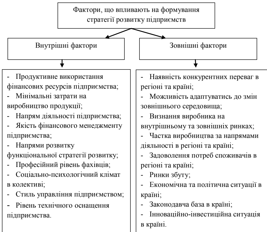
Рис. 2 Фактори, що впливають на формування стратегії розвитку підприємства [13]