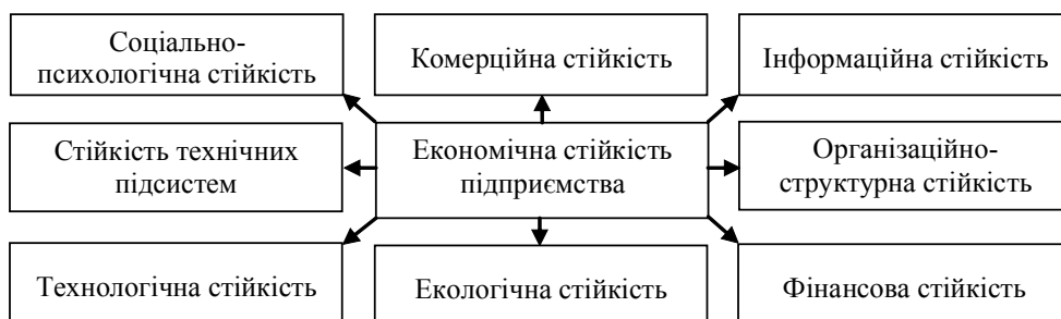
Рис. 1. Система економічної стійкості промислового підприємства (добробок авторів)

товароруху, формування попиту, стимулювання збуту і регулювання поставок матеріально-технічних ресурсів заданої якості [6].