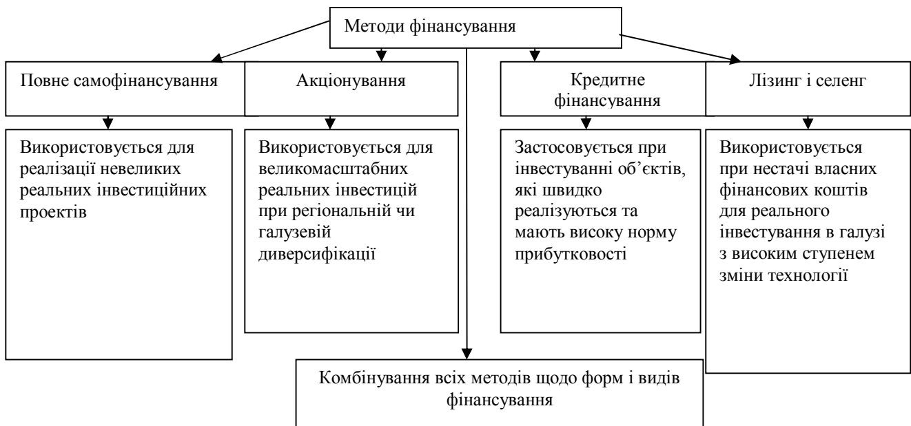
Рис. 2. Методи фінансування інвестиційної діяльності

них зумовлений певними чинникам, що використовується за наявності певних умов, які наведені на рисунку 2.