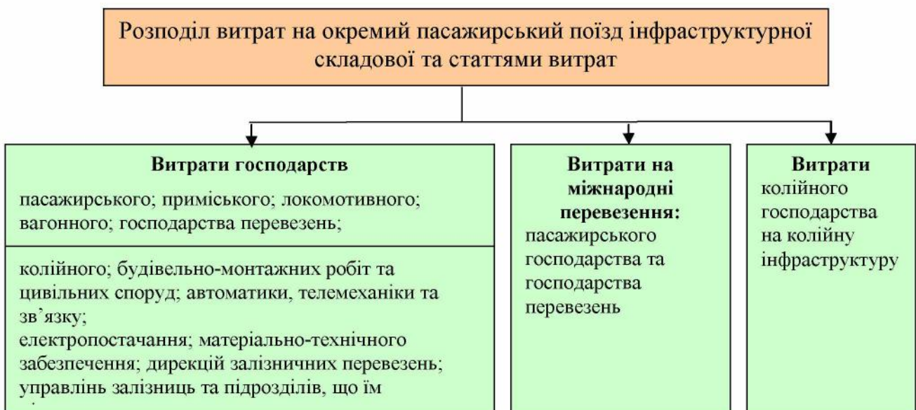
Рис. 1. Принципи розподілу витрат на окремий пасажирський поїзд за інфраструктурною складовою по статтях витрат з метою визначення його ефективності

На основі аналізу усіх витрат, що увійшли в інфраструктурну складову сформовано 3 групи витрат, які розраховуються за різними принципами (рис. 1).