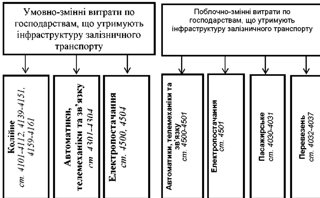
Рис. 2. Розподіл умовно- та поблочно-змінних витрат на утримання інфраструктури за господарствами

знос інфраструктури та обсяг яких змінюється прямо-пропорційно обсягу перевезень.