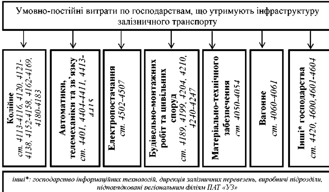
Рис. 3. Розподіл умовно-постійних витрат на утримання інфраструктури за господарствами