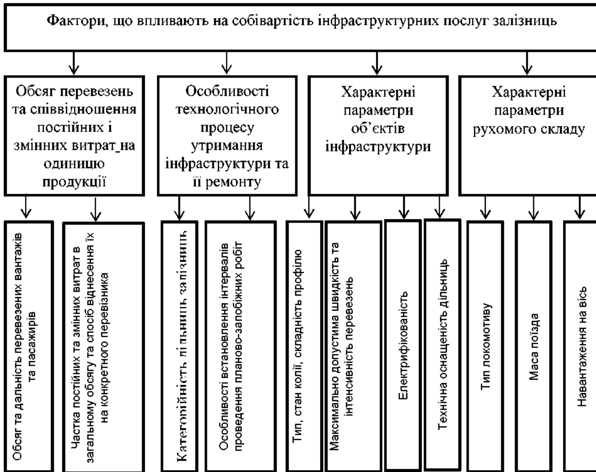
Рис. 5. Фактори впливу на собівартість послуг інфраструктури залізничного транспорту

4) характерні параметри рухомого складу.