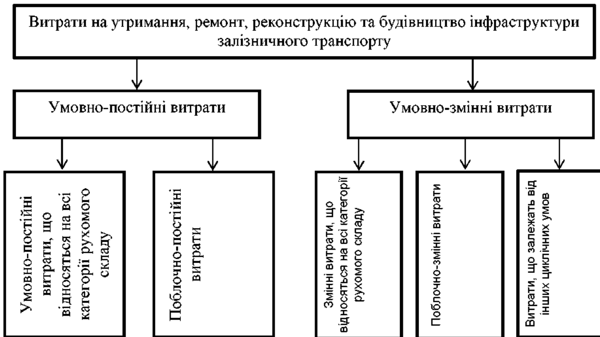
Рис. 1. Класифікація витрат на надання інфраструктурних послуг залізничного транспорту в залежності від обсягу перевезень та деяких циклічних факторів

На рис. 1 автор пропонує класифікацію витрат на утримання інфраструктури в залежності від обсягу перевезень залізничним транспортом.