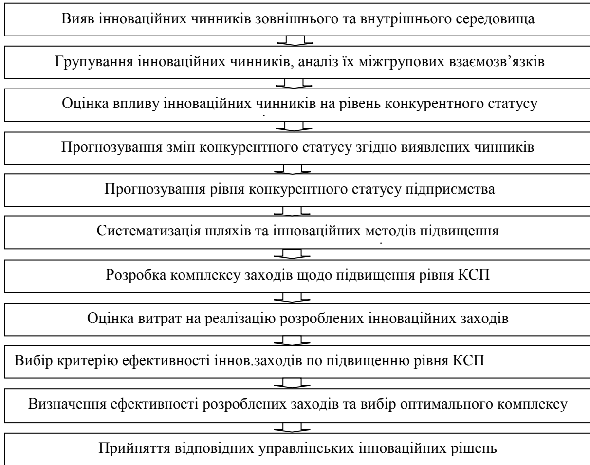
Рис.2. Етапи інноваційного управління конкурентним статусом підприємства

Висновки. При сучасному темпі інноваційного розвитку економіки країни підприємства повинні приділяти максимальну увагу рівню свого конкурентного статусу, й бути максимально гнучкими та реагувати на інноваційні зміни умов їх функціонування, концентруватися на досягненні максимального рівня конкурентних переваг. Конкурентний статус підприємства виступає критерієм ефективності здійснення фінансово-господарської діяльності, передумовою його розвитку та успіху на ринку. Тому оцінка рівня конкурентного статусу – одне з актуальних питань в системі управління будь-якого підприємства. Оцінка конкурентного статусу дозволяє виявити реальні шанси та інноваційні можливості підприємства, встановити інноваційні