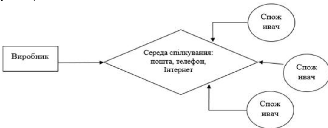
Рис. 1. Залежність маркетингу від середовища спілкування [за джерелом 6]

Засоби прямого маркетингу залежать від середовища спілкування, яку вибрали виробник (розповсюдjuвач) товару або послуги, а також підтримали споживачі (рис. 1).