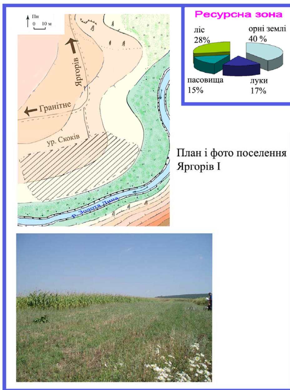
Рис. 1. План і фото поселення Яргорів-I та його найближчого оточення (за М. А. Филипчуком).