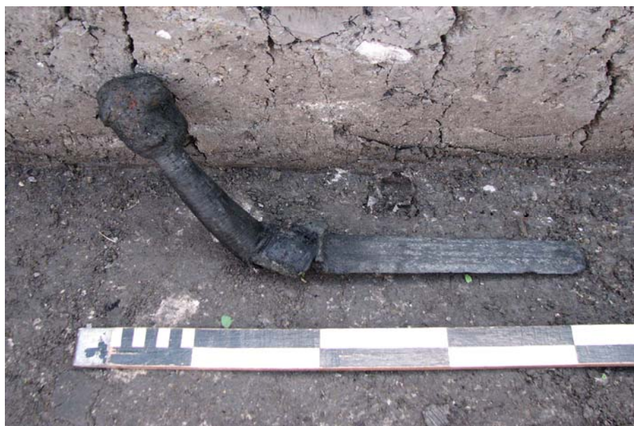
Рис. 3. Частина меча на час виявлення.