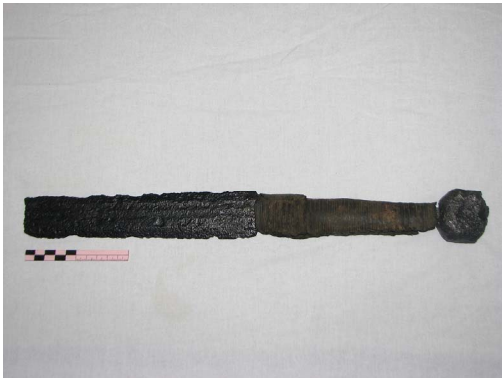
Рис. 4. Частина меча після реставрації.