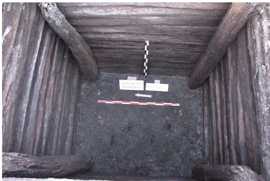
Рис. 2. Дерев'яний підвал. Вигляд зі заходу.