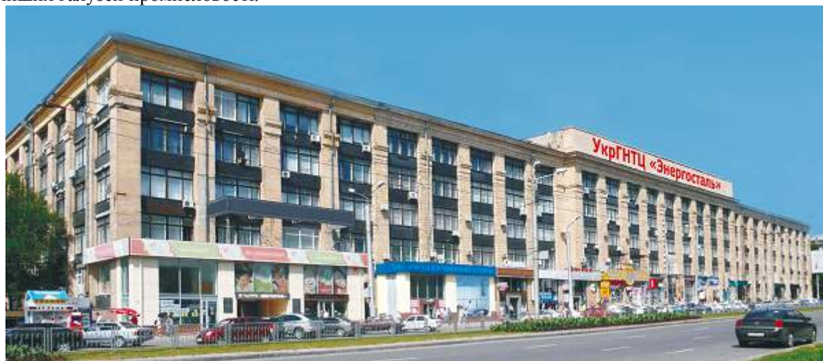
Найбільш значні напрями діяльності УкрДНТЦ «Енергосталь»:

Розробки Центру, технології та проекти, а також обладнання, що поставляється замовникам, істотно впливають на сучасний технічний рівень і стан гірничо-металургійної галузі України, ряду підприємств Росії, Казахстану та інших країн СНД, а також підприємств інших галузей промисловості.