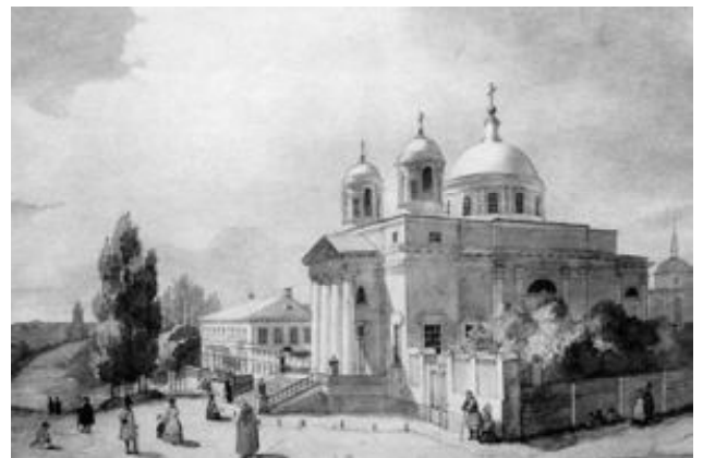
Рис. 3. Костел Св. Олександра у Києві. 1846. Папір, акварель. 25,5x34,6.

Митець підготував 5 альбомів, але за його життя був виданий тільки перший (1839-1844 рр. С.-Петербург). Використовуючи численні малюнки, ескізи, етюди, в ньому він показав минуле і сучасне свого народу, його життя і побут, красу рідного краю, архітектуру та історичні пам'ятки України.