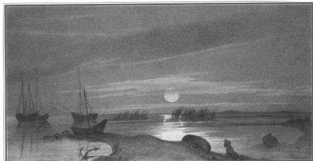
Рис. 4. Місячна ніч на Косаралі. 1848-1849. Папір, акварель. 15,0x29,2.

"Благороднійший ти із людей, брате-друже мій єди-