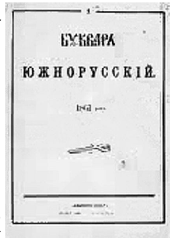
Рис. 6. Букварь южнорусский.

Марко Вовчок (літературний псевдонім М. О. Вілінської) (1833-1907) - відома письменниця. Її твори дістали високу оцінку прогресивної громадськості, зокрема Т. Г.