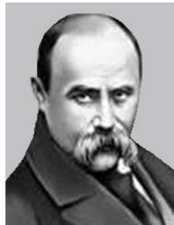
Рис. 1. Т.Г.Шевченко.