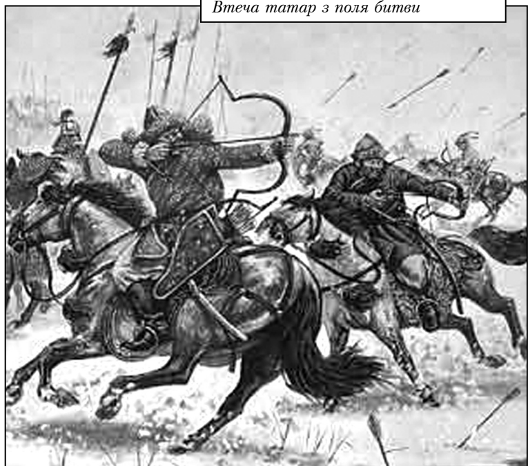
Втеча татар з поля битви

Орди, а це було головним, життєво важливим завданням українського народу. Тому то заняття Києва відбулося без боротьби: Ольгерд змістив ординського намісника й віддав Київ в управління своєму синові Володимирі. Подільську землю Ольгерд віддав племінникам, синам брата Коріата (в хрещенні – Михайло): Юрію, Олександрі, Костянтину, Федору (Коріатовичам), які управляли всім Поділлям, «іменуючись» його князями й господарями. Саме цей факт лежав в основі обґрунтування Литовською стороною на особливі права володіння прилученою територією. До речі, син Коріата-Михайла Гедиміновича – Дмитро Коріатович (у московських хроніках відомий як воевода Боброк Волинський) був одружений на сестрі Великого князя московського Дмитра Донського. Отже, під впливом родового герба Коріатовичів, Юрій Зміборець стає гербом Московських князів та Москви, а син Дмитра Донського – князь Василь починає карбувати монети зі зображенням святого Юрія на коні зі списом (копьем) –