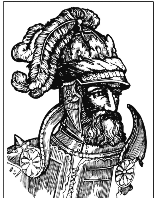
Великий князь литовський ОЛЬГЕРД

Але воля болохівців не ламалася, і кожного разу з відходом галичан болохівські громади відновлювали старі порядки. Тому практично всі болохівські міста і містечка були укріпленими фортецями. Саме під зверхністю ординців болохівці намагалися відшукати більшу свободу і легше оподаткування. Князі болохівські були поборниками обласної автономії та рішучими противниками централізованого державного ладу, такі собі «середньовічні махновці», що зайвий раз підтверджує про генетично-невмирущу спадкоємність українського етносу. З цього приводу дуже слушно зауважив Микола Дорош: «з татарською допомогою болохівці «виломлювались» з-під опіки київських та галицьких князів, створювали свої автономні громади вільних людей. Може,