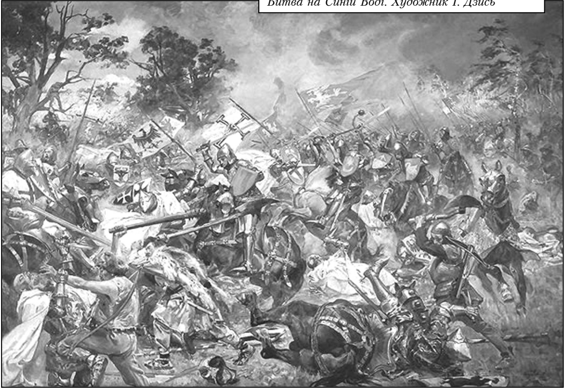
Битва на Синій Воді. Художник І. Дзись

крутий і глинистий. Ця особливість берегів дуже ускладнювали б атаку татарської кінноти у випадку її виходу в тил литовсько-руського війська. Таким чином, Ольгерд дуже вдало вибрав місце для битви.