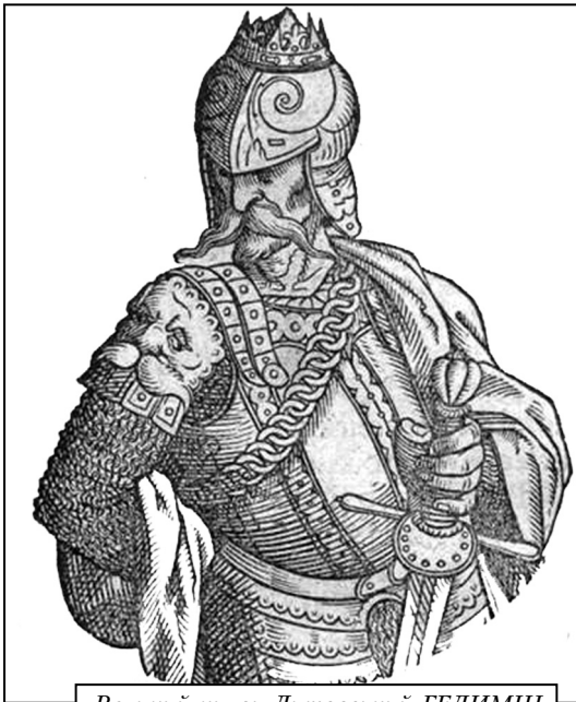
Великий князь Литовський ГЕДИМІН

носин з Польським королівством і Німецьким орденом, виступив проти ординського владарювання в межиріччі Дніпра і Дунаю. Початковий склад війська було сформовано в Білорусі: у володіннях Коріатовичів, в землях Андрія Полоцького, в Пінському князівстві Петрікія Наримонтовича, а також були залучені полки заславського володаря князя Явнута, під орудою його сина Михайла. Військо Ольгерда згодом значно поповнилося волинськими дружинами князя Любарта і військовими формуваннями з Київщини.