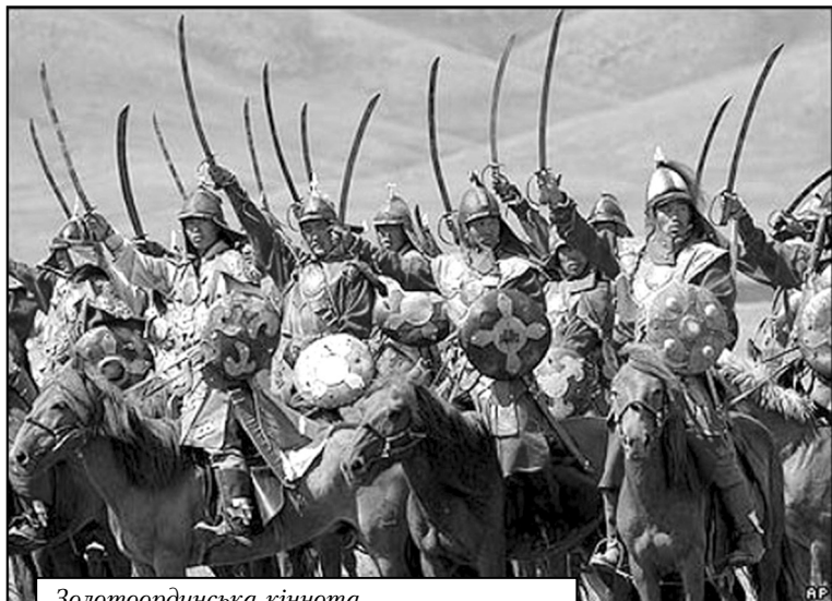
Золотоординська кіннота (реконструкція виконана в Улан-Баторі)

Вибираючи місце, яке б найкраще підходило як поле брані, Великий князь Ольгерд, очевидно, зупинився на районі сучасного поселення Лозна на річці Снивода. Він оглянув, так звану «підкову», що утворювалася вигином ріки, а також круті береги потічка Батіжок, що впадав у Сниводу. Рельєф цієї місцини сам по собі сприяв підсиленню позицій військ, тому дуже підходив для битви. Повідомлення про бой-