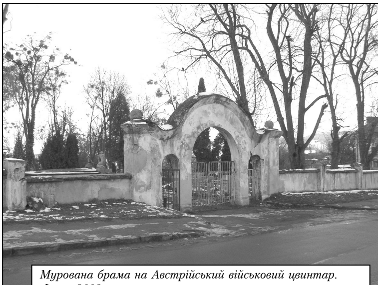
Мурована брама на Австрійський військовий цвинтар. Фото 2008 р.