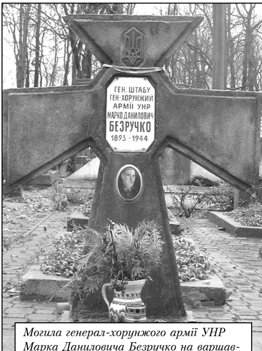
Могила генерал-хорунжого армії УНР Марка Даниловича Безручка на варшавському кладовищі «На Волі».

Тепер, з висоти нашого часу ми можемо з гордістю сказати, що в 1920 році українські і польські війська врятували Європу від більшовицької зарази, не давши можливості Москві організувати військову інтервенцію на Захід з метою втілення в життя своїх несусвітніх планів світової революції. Правда слід зазначити, що і польська, і українська держави поки що небагато зробили для того, щоб гідно вшанувати українсь-