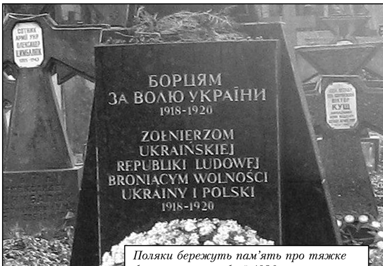
Поляки бережуть пам'ять про тяжке братерство по зброї 1920 року.

Мабуть тут доречно буде процитувати уривок з вірша Олени Теліги: