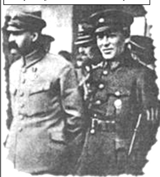
Юзеф Пілсудський і Симон Петлюра

Проте Пілсудський недооцінив мілітарної сили більшовиків і не надав достатньої уваги зміцненню як своєї армії, так і української. Червона армія 5 червня 1920 року, прорвавши фронт на ділянці Канів-Біла Церква, перейшла в контрнаступ, завдала поразки 3-й польській армії і примусила