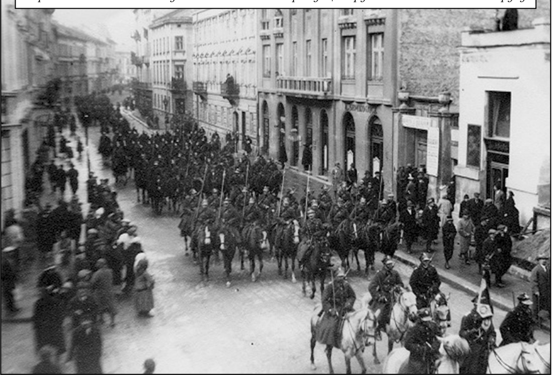
Парад Війська Польського у Львові.

Західну Волинь. Більшовики були готові віддати більше. Однак поляки розуміли, що тоді українська меншість у польській державі стала б занадто чисельною і асимілювати її було б неможливо.