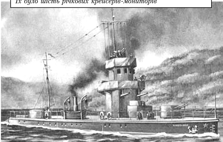
Їх було шість річкових крейсерів-мониторів

граничного загону. О 4 год 15 хв румунські батареї відкрили вогонь по радянській стороні – Рені, Карталу, Ізмаїлу, Кілії, Вилковому і кораблям флотилії. Ізмаїл обстрілювали також два румунських монітора, що вийшли з Сулинського в Кілійське гирло Дунаю. Оцінивши критичність ситуації, контр-адмірал Абрамов, у 4.20 самостійно віддав наказ відкрити вогонь у відповідь. Обстріл з румунського берега дещо послаб-