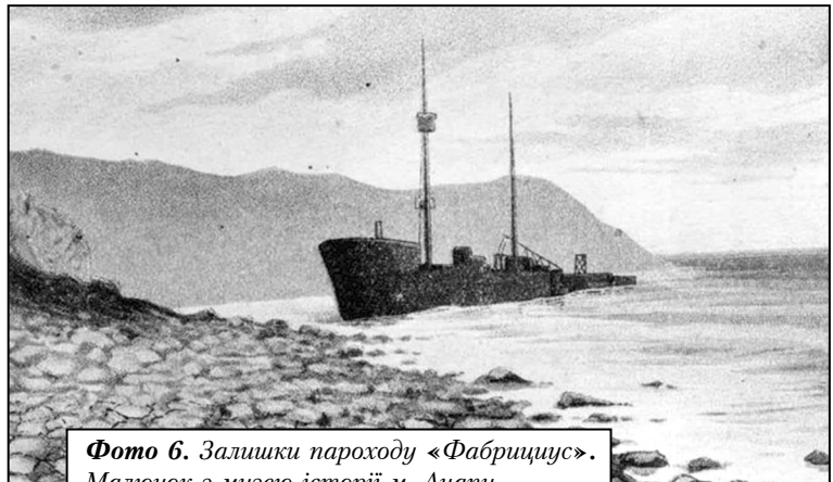
Фото 6. Залишки пароходу «Фабрициус». Малюнок з музею історії м. Анапі

5 вересня торпедний катер «MAS-568» (командир – лейтенант Майно) торпедував радянський вантажний пароплав «Фабрициус» (фото 6 [36]) [18]. Проте, судно той час вже було залишене екіпажем як непридатне для подальшої експлуатації. Відомо, що 2 березня 1942 р. радянський транспорт (раніше вантажний пароплав) «Фабрициус», який брав активну участь в перекиданні маршових поповнень, провізії та фуражу в перші місяці війни, був атакований німецьким літаком-торпедоносцем під час переходу по маршруту Новоросійськ – Камиш-Бурун. На його борту знаходилося 700 військовослужбовців, бойова техніка, коні й продовольчий фураж. Пошкоджене судно було посажено командою на мілину поблизу мису Утріш в точці з координатами 44°45' півн. ш., 37°28' півд. д. [37]. Екіпаж