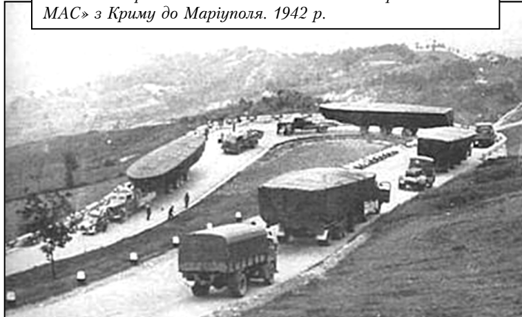
Фото 8. Перехід «Колони Моккагатта 10-ї флотилії МАС» з Криму до Маріуполя. 1942 р.

морської блокади Севастополя. Подібні сили радянського ВМФ на Чорноморському театрі застосовувалися обмежено наприкінці війни, а німецького – взагалі участі не брали.