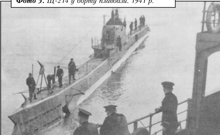
Фото 5. Щ-214 у борту плавбази. 1941 р.