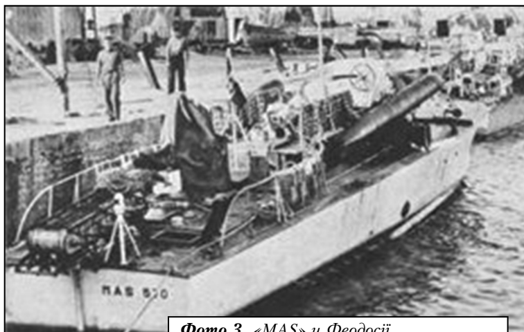
Фото 3. «MAS» у Феодосії

18 червня 1942 р. два торпедні катери «MAS» атакували самохідні баржі, що перевозили війська до Севастополя. У цьому бою був потоплений радянський транспорт (назва знов не наводиться – прим. авт.) [18]. В інших джерелах чітко вказано назву потопленого судна, дату, час, місце та причину його загибелі, зокрема: «... теплохід «Белосток» затонув в районі мису Фіолент поблизу Севастополя, в результаті торпедування італійськими торпедними катерами в ніч з 18 на 19 червня 1942 р.» [26]. Слід також відмітити, що в [27] вказується про