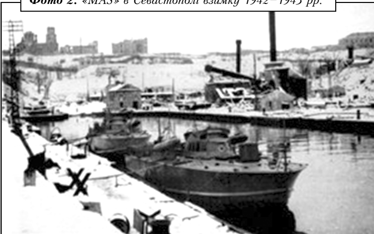
Фото 2. «MAS» в Севастополі взимку 1942–1943 рр.

Активні дії італійської флотилії відмічаються в період з квітня 1942 р. по травень 1943 р., в ході якого було здійснено